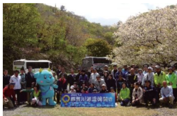
▲那賀川源流碑開き