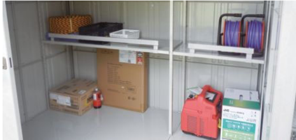
▲道の駅「四万十とおわ」の防災倉庫と防災備品(四万十町)

「道の駅」の防災機能向上のため、四国管内の道の駅に平成28年度から防災倉庫等の防災用品を支援しています。令和4年は9駅へ防災倉庫、防災照明灯、投光器など防災用品をご支援しました。