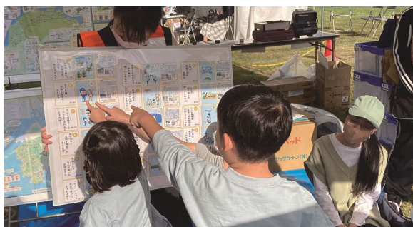
▲徳島大学環境防災研究センター 国営讃岐まんのう公園にて防災学習