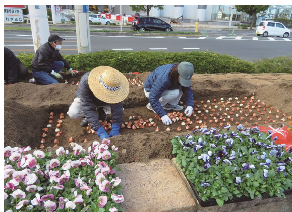
▲道路環境啓発イベント(R30号 玉藻公園前)