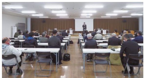
▲香川大学 ジオツーリズムによる地域活性化シンポジウム