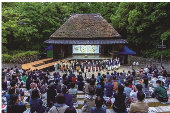
▲瀬戸内国際芸術祭2022