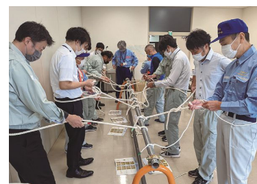
▲水防技術講習会 (香川県中讃土木事務所)