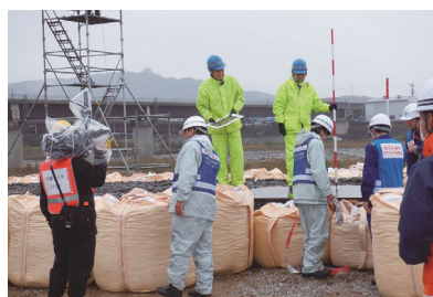
▲大規模津波防災総合訓練 (南国市津波避難施設)