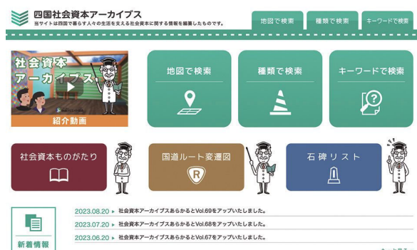
▲四国社会資本アーカイブスホームページ

令和4年5月27日に四国社会資本アーカイブスが土木学会四国支部の地域貢献賞を受賞しました。