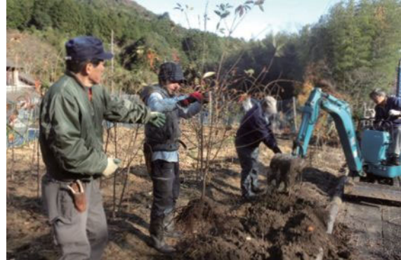
▲(日本風景街道)日本一美しい枝垂れさくらの町づくりをめざす