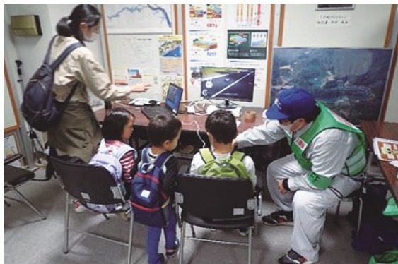
▲ダム活用事業～蛭湖まつりと横瀬川ダム植樹祭～