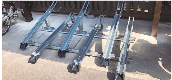
▲道の駅「よって西土佐」のサイクルラック(四万十市)