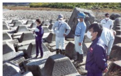
▲松山河川施設管理部会(重信川河川巡視)