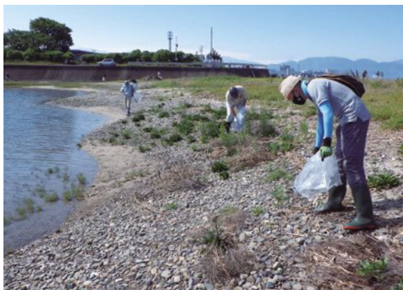
▲重信川クリーン大作戦

松山支所では、重信川の環境保全活動等のボランティア活動に参加。本所では玉藻公園前の花植え活動に参加。このように四国各地で積極的に参加しています。