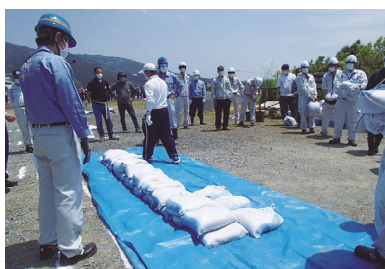
▲肱川水防工法訓練 (肱川防災ステーション)