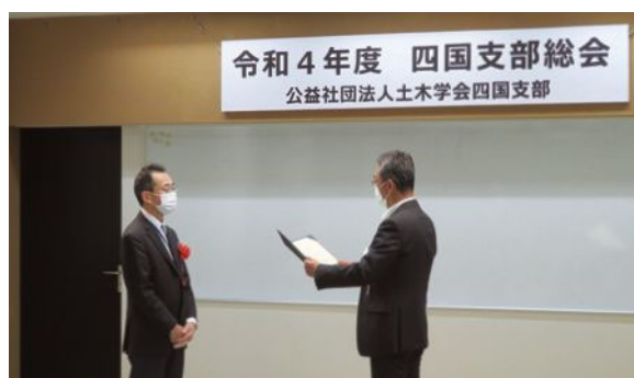
▲土木学会四国支部賞表彰式 R4.5.27