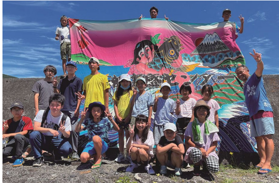
▲海辺の防災ワークショップ