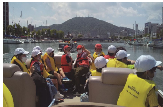
▲新町川等の河川清掃及び無料遊覧船の運航