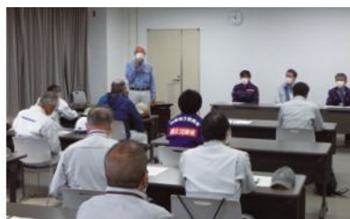
▲松山河川施設管理部会(重信川河川巡視開会式)