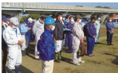
▲香川河川施設管理部会(土器川河川巡視)

河川施設管理部会では、一級河川土器川、重信川、石手川の徒歩巡視と一級河川土器川の源流碑清掃を、道路施設管理部会では一般国道11号、32号の徒歩点検を実施しています。