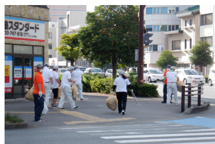
▲徳島支所(支所近くの道路で清掃活動)