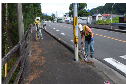
▲高知支所(奈半利出張所近くの道路で清掃活動)