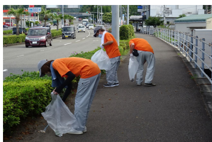
▲高知支所(支所近くの道路で清掃活動)