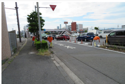
▲松山支所(支所近くの道路で清掃活動)